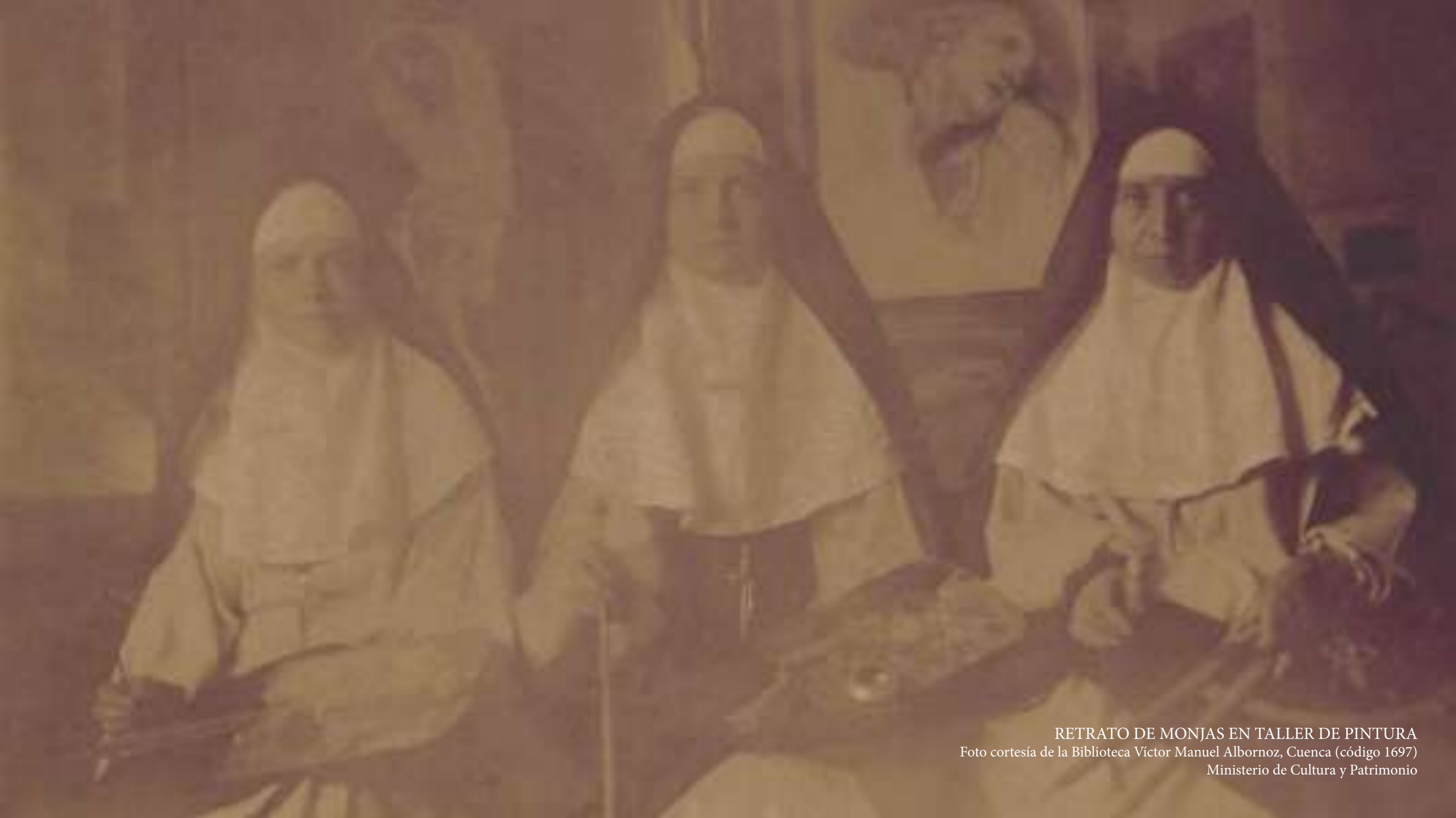
RETRATO DE MONJAS EN TALLER DE PINTURA Foto cortesía de la Biblioteca Víctor Manuel Albornoz, Cuenca (código 1697) Ministerio de Cultura y Patrimonio