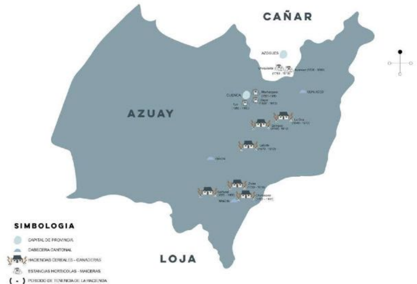
MAPA HACIENDAS CONCEPCIONISTAS

Fuente: Catálogo del archivo histórico del Monasterio de las Conceptas de Cuenca Localización de las haciendas del Monasterio desde 1601 hasta 1910.