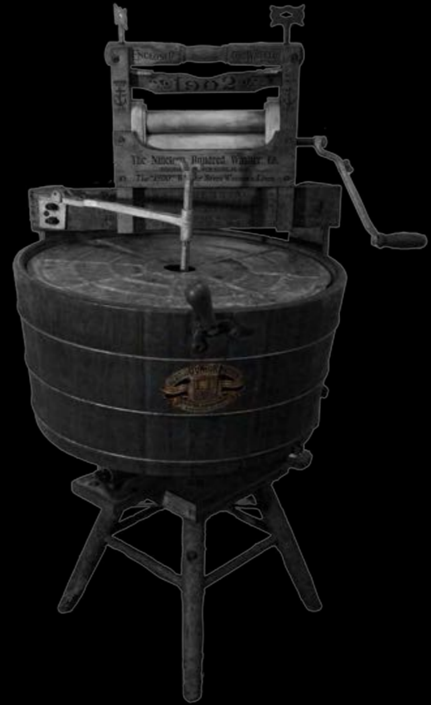
Máquina de lavado de uso manual, s.XX madera