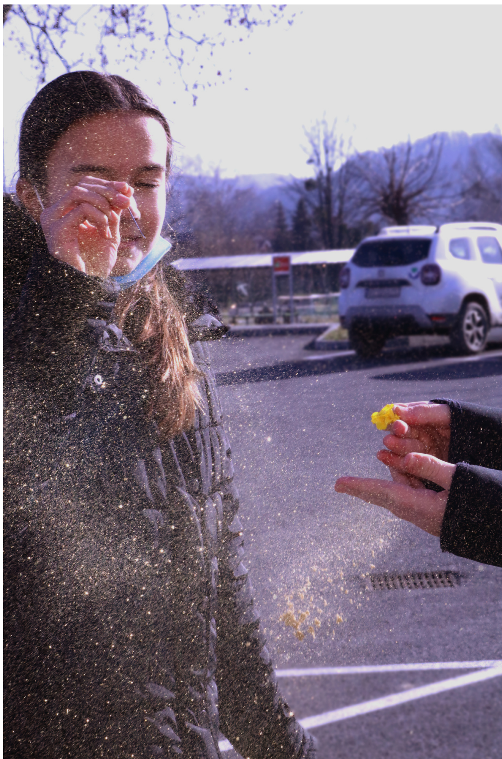
Eksperiment - šljokice