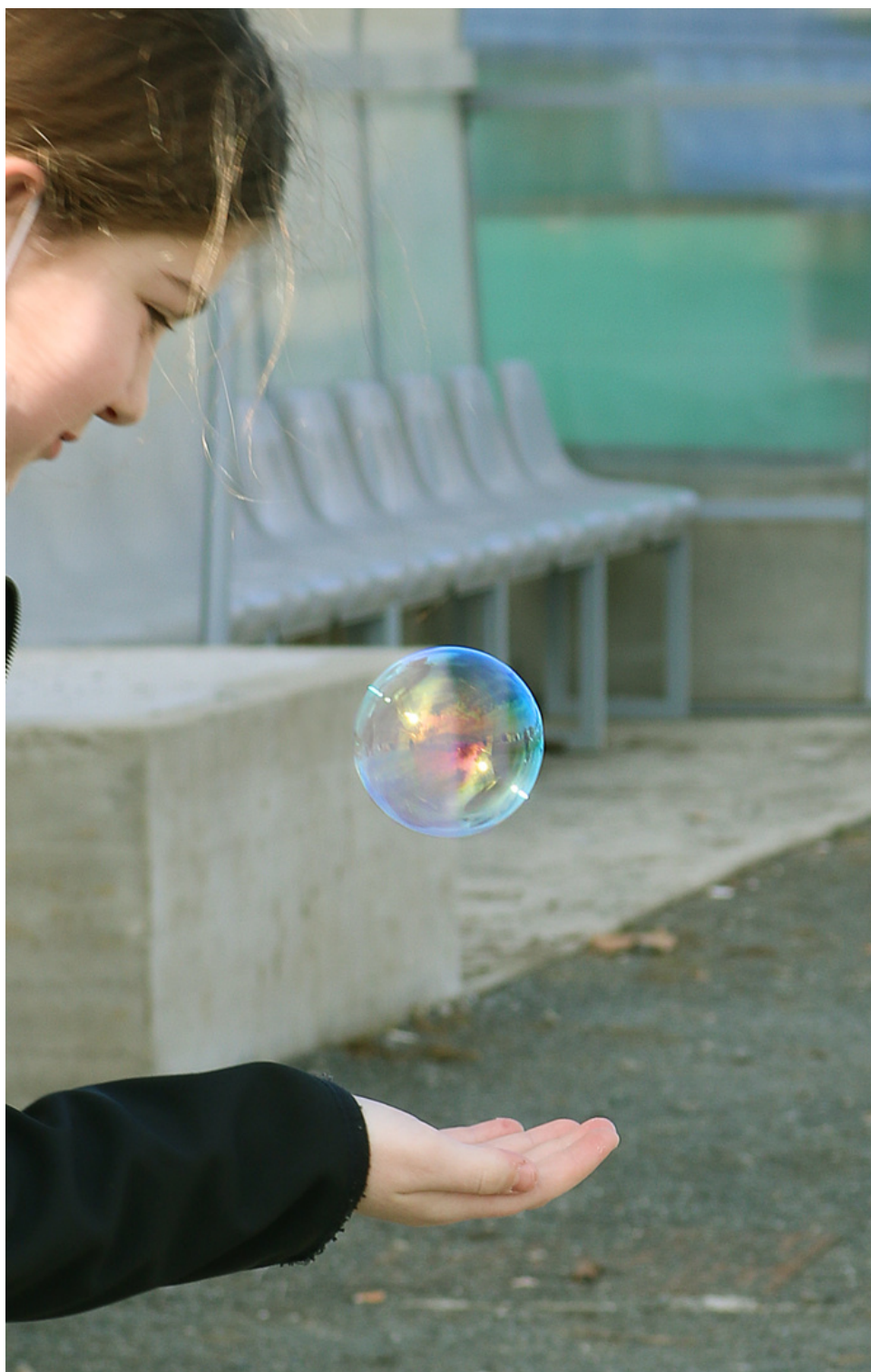
Eksperiment - mjehurići