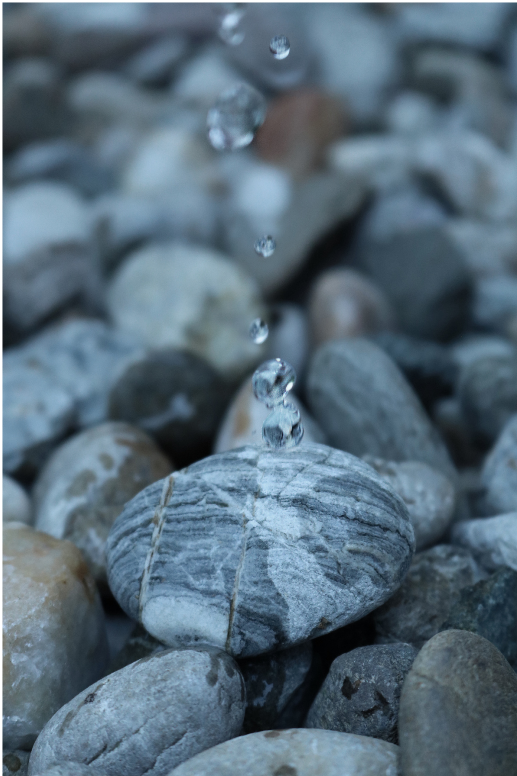
Kap po kap