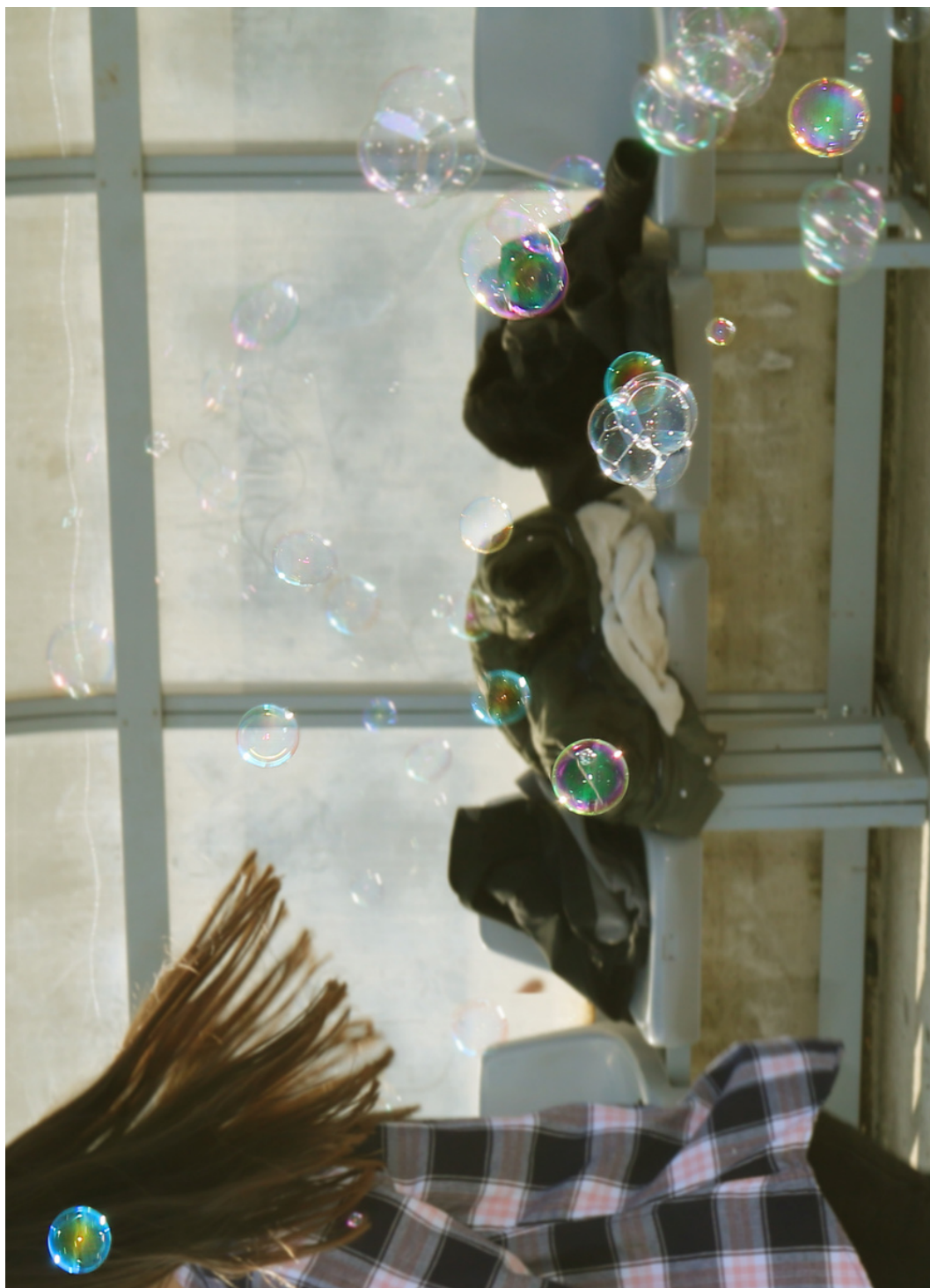
Eksperiment - mjehurići