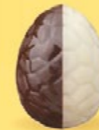
Praliné avec éclats de noisettes