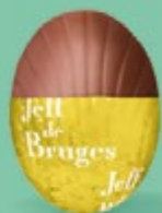
Praliné et éclats d'amandes caramélisées et salées