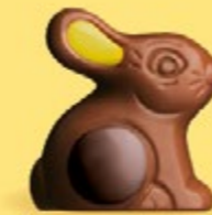
Praliné et riz soufflé