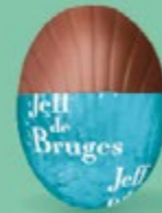
Ganache chocolat noir Équateur