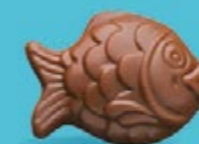
Chocolat au lait 36% de cacao