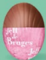
Praliné noisettes façon pâte à tartiner