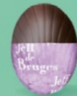
Praliné et biscuit sablé