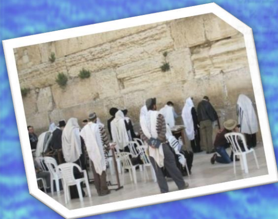
"ולוואי יתפלל האדם כל היום כולו"

קורין את שמע בערבין. משעה שהכהנים נכנסים לאכול בתרומתן עד סוף האשמורה הראשונה דברי ר' אליעזר. וחכמים אומרים עד חצות. רבן גמליאל אומר עד שיעלה עמוד השחר. מעשה ובאו בניו מבית המשתה אמרו לו לא קרינו את שמע אמר להם אם לא עלה עמוד השחר חייבין אתם לקרות ולא זו בלבד אמרו אלא כל מה שאמרו חכמים עד חצות מצותן עד שיעלה עמוד השחר והקטר חלבים ואברים מצותן עד שיעלה עמוד השחר והוכל הנאכלים ליום אחד מצותן עד שיעלה עמוד השחר א"כ למה אמרו חכמים עד חצות כדי להרחיק