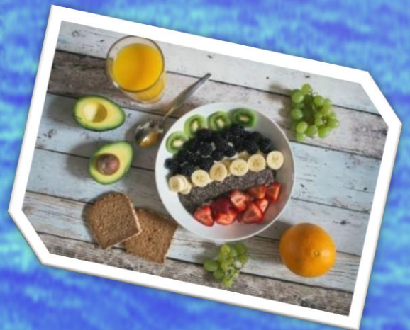
"כיצד מברכין על הפירות?"