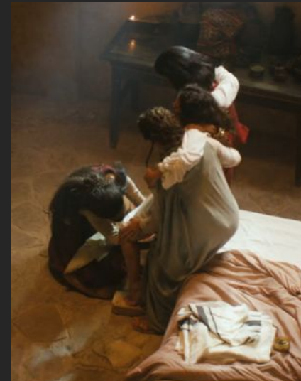
Miniserie: The Red Tent. 2014