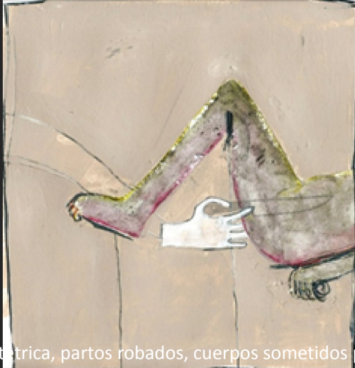
Violencia obstétrica, partos robados, cuerpos sometidos publicado en la revista digital Pikara en 2018 por Eva Margarita García