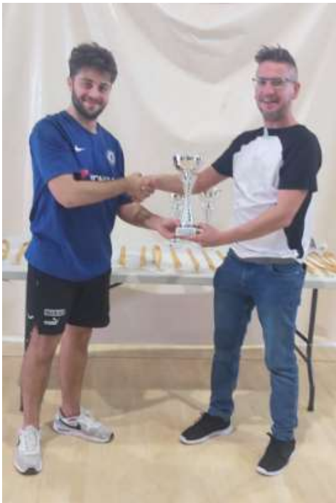
CHELSEA CAMPEON DE CONSOLACION