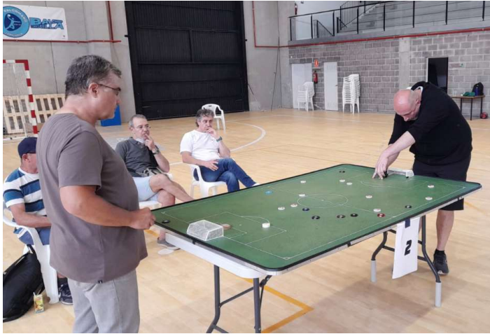
Final del mediterraneo