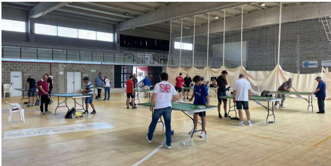
Gran ambiente botonístico durante toda la jornada