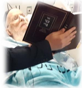
אלול תשפ"א. רופא חולי עמו ישראל