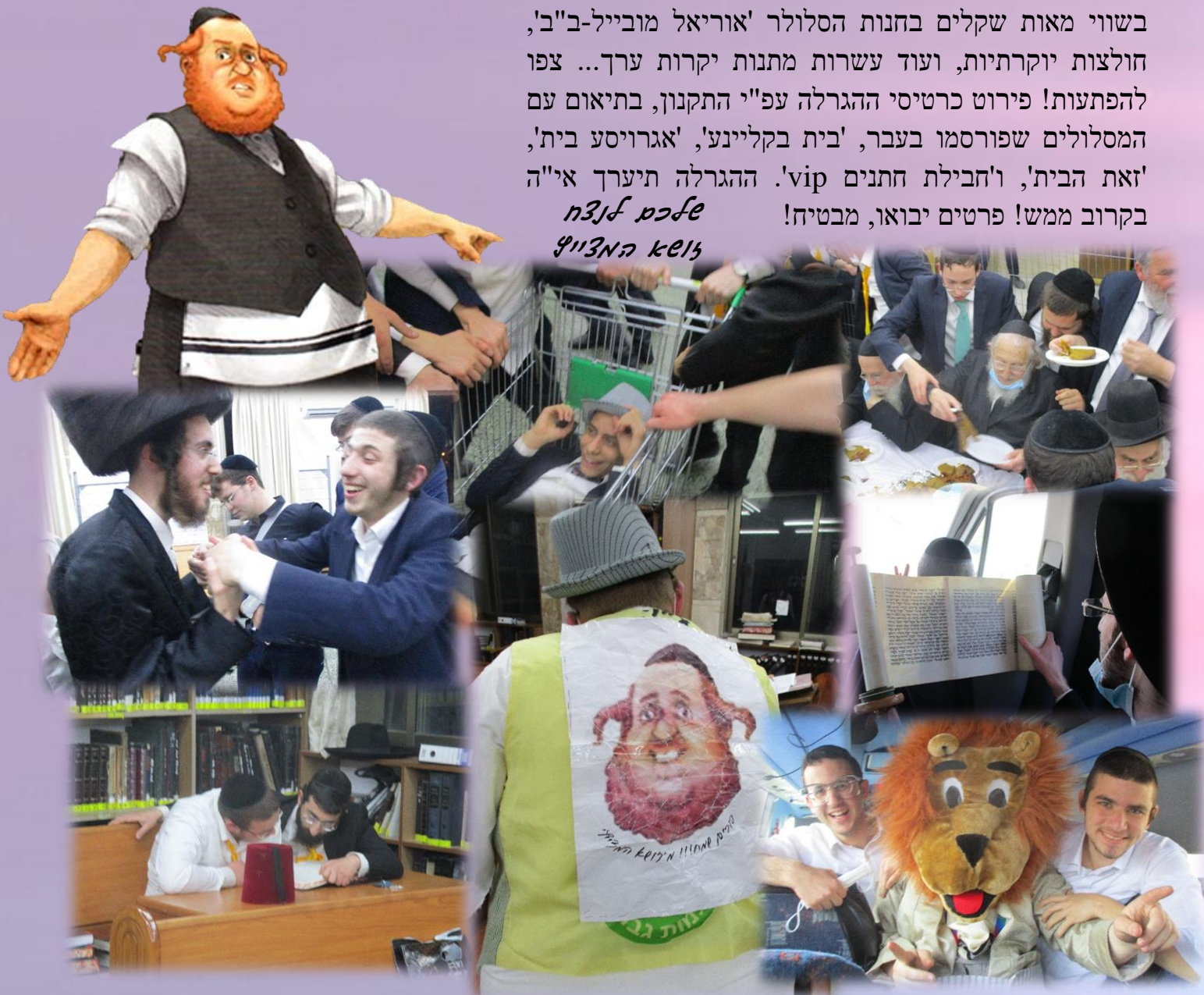
סיכום האיסוף ת"ת פורים תשפ"א