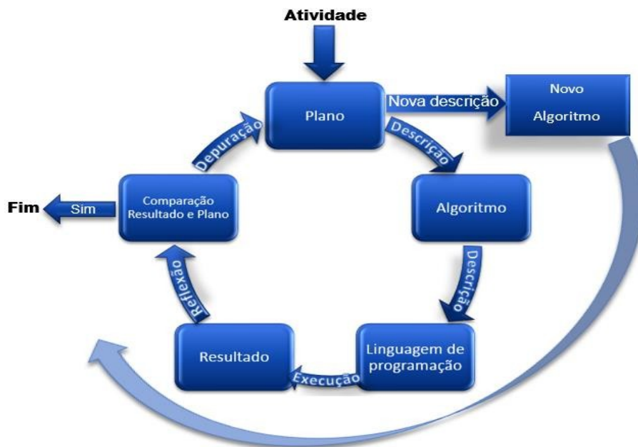
Figura 1 - Fluxograma das ações envolvidas na programação, baseado na espiral de aprendizagem descrito por Valente (2005).

professor. Na programação, as ações a serem esquematizadas podem ser descritas de acordo com a espiral de aprendizagem (VALENTE, 2005) indicada na Figura 1.