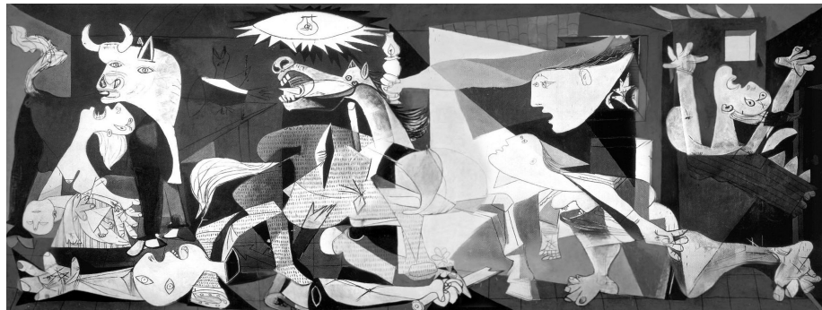
Pablo Picasso: Guernica . 1937. Óleo sobre lienzo. 349,3 x 776,6 cm. Museo Reina Sofía, Madrid.

Actividad 3. Observa la obra Guernica del artista español Pablo Picasso y lee la descripción que el artista hizo de ella en 1937, durante la guerra civil española. Escribe una reflexión en la que relaciones esta obra con la capacidad del ser humano de representar sentimientos y compárala con la obra del pintor salvadoreño Antonio Bonilla Nuestra herencia , creada durante el conflicto armado salvadoreño de fines del siglo XX.