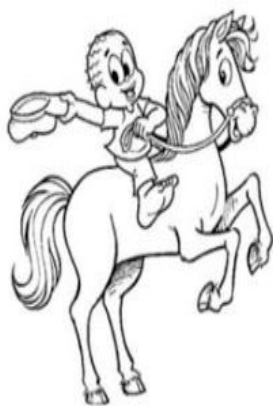
NEGRINHO DO PASTOREIO

2) Multiplique os números de acordo com cada coluna: