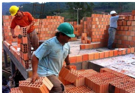
Homens trabalhando em construção, Porto Alegre, 2019.

ATENÇÃO: As atividades 04 e 05 podem ser feitas em uma folha chamex.