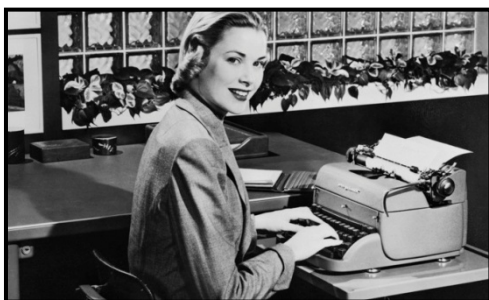
Datilógrafa na cidade do Rio de Janeiro no ano de 1970.

5. Por meio do trabalho, os primeiros grupos humanos já transformavam elementos da natureza em alimentos, ferramentas, roupas, utensílios e moradias. Ao longo da história, muita coisa mudou e continua mudando no mundo do trabalho e das atividades humanas. Observe as imagens de algumas profissões: Responda às questões: