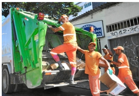
Garis trabalhando em Contagem/MG. 2015.