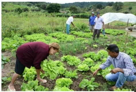
Dia do agricultor, São Paulo/SP, 2011.