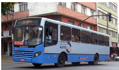
Ônibus da empresa São Jorge Auto bus, Ponte Nova/MG 2017.

4. Você sabe que além da família, dos professores, dos funcionários da escola e dos amigos e conhecidos, muitas outras pessoas participam de nossa vida por meio de seu trabalho. O trabalho é fundamental para a continuidade da vida e da sociedade. Observe as imagens, identifique cada profissão e escreva uma frase bem legal para cada uma: