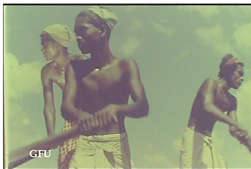
රූපය 5: මී ගමුවේ මස් මරන්නෝ චිත්‍රපටයේ වෙළඳ පොළදර්ශනයක් (මාළු වෙන්දේසිය); රූපය 6: ජනලීලා චිත්‍රපටයේ පාරු පදින්නන්