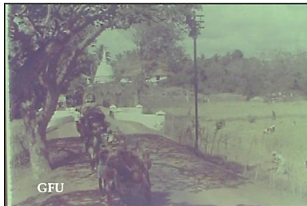
රූපය 7: ජනලීලා චිත්‍රපටයේ පාරු වල සිට ගැල් වලට බඩු ගෙනයාම; රූපය 8: ජනලීලා චිත්‍රපටයේ දැක්වෙන දර්ශනයක්