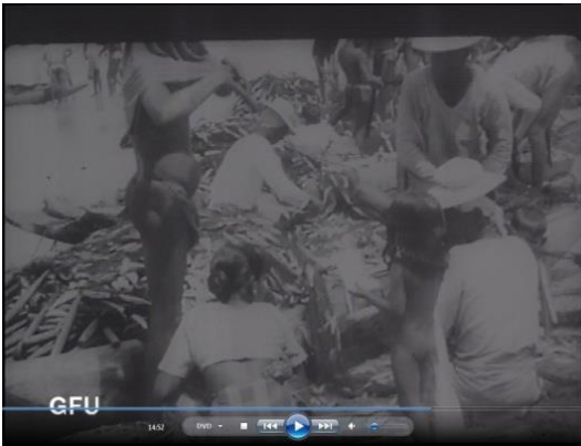
රූපය 4: මී ගමුවේ මස් මරන්නෝ චිත්‍රපටයේ මසුන් එකතු කිරීම.

කණ්ඩායම, "කරදිය", "ජන ලීලා" යන චිත්‍රපට දැක්විය හැක. මෙහි දැක්වෙන "ජන ලීලා" චිත්‍රපටයද, "The living wild" චිත්‍රපටයද ජාත්‍යන්තර සම්මානයට පාත්‍ර වූ අගනා වාර්තා සිනමා කෘතීන්ය.