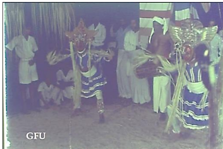
රූපය 9: ජනලීලා චිත්‍රපටයේ එන පෙරහැර දර්ශනයක් (වාදනය කරමින් නර්තනය); රූපය 10: ජනලීලා චිත්‍රපටයේ එන පෙරහැර දර්ශනයක් (යක් නැටුම්)

මෙලෙස සිදු කරන ලද තවත් භාවිතාවක් ලෙස දේශපාලනික උත්සව අවස්ථා හා දේශපාලන ප්‍රචාරණ කටයුතු සඳහා වාර්තා චිත්‍රපටය භාවිත වූ අවස්ථා දැක්විය හැකිය. මෙලෙස නිර්මාණය වූ චිත්‍රපට විශාල ප්‍රමාණයක් 50/60 දශකයන් හි දී දැකගත හැකි වේ. ඉන් කිහිපයක් පහත අයුරින් දැක්විය හැකිය.