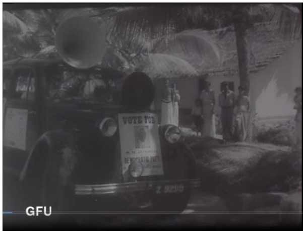
රූපය 2: නෙලුන්ගම වික්‍රමයේ ඡන්ද ප්‍රචාරණය දර්ශනයක්

සංවර්ධනය සම්බන්ධයෙන් භාවිතාවට ලක්වන ලද වික්‍රමය පිළිබඳව සලකා බැලීමේදී “නෙලුන්ගම” යනු අමතක කළ නොහැකි තවත් එක් නිර්මාණයකි. මෙහිදී තේමාව වී ඇත්තේ “ප්‍රජාතන්ත්‍රවාදය” යන සංකල්පයයි. ප්‍රජාතන්ත්‍රවාදී යහපත් සමාජයක් ගොඩනැගීම සඳහා මෙම සංකල්පය පිළිබඳව සමාජ දැනුවත් වීමක් තිබිය යුතු අතර එම කාර්යය සිදුකිරීමේ පරමාර්ථයෙන් “නෙලුන්ගම” වික්‍රමයේ භාවිතය සිදුවී ඇතිබව පෙනී යයි. එමෙන්ම ගම තුළ සංවර්ධන කාර්යය සිදුවන්නේ කෙලෙසකද යන්න පිළිබඳවද යම් සාකච්ඡාවක් සිදු කිරීමට මෙය භාවිත වේ.