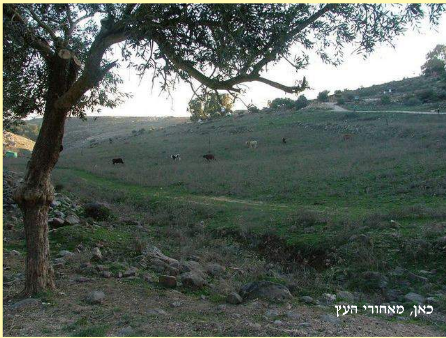
כאן, מאחורי העץ