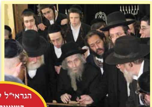
הגרא"ל שטיינמן בשיעור כללי בהיכל ישיבת ברסלב בני ברק