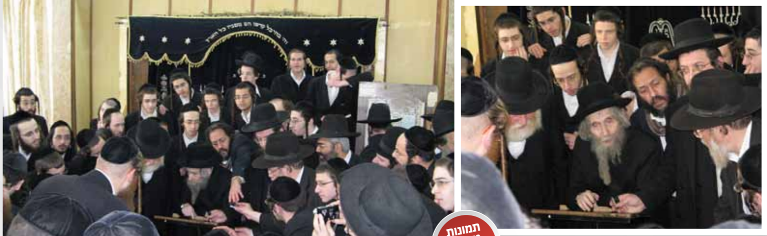
תמונות נדירות בפרסום ראשון

המגיד שיעור: לא צריך להיות גאונים גדולים כדי לחשב את העתיד לפי העבר. כשאנו רואים מרביצי תורה ידועים, שמכניסים יותר ויותר מתכני החסידות לשיחותיהם, לדוגמה הרב משה שפירא זצ"ל, או יבדלחט"א הרב משה בויאר שליט"א, ועוד רבים, ואנו רואים את הציבור הענק שעט בצימאון על כל טיפת יהדות חסידית, אם זה באומן, אם זה במירון, אם זה אצל משפיעים חסידיים רבים, אנחנו קולטים שיש כאן תזוזה חד משמעית לכיוון אור החסידות. לאן בדיוק זה יגיע? לביאת המשיח בוודאי, רק תפילתנו, שזה יהיה ברחמים. ■