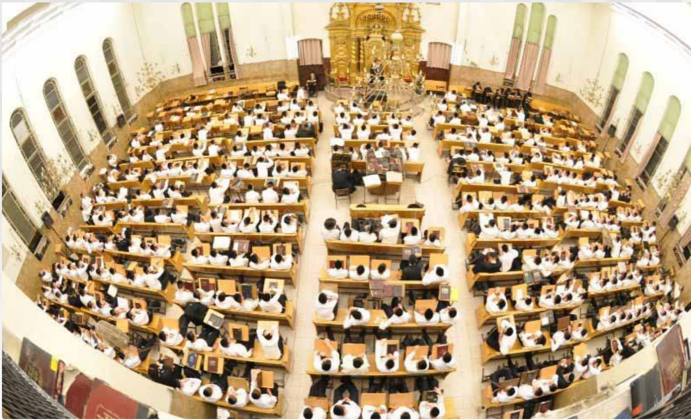
ליטבישע הערצער (לבבות ליטאים). היכל ישיבת פונוב'ז

הנסיעה, ולומר לו שיתפלל על כך, אבל לא מורים לו לנסוע. יגיע היום והוא יעשה את זה בלי לשאול.