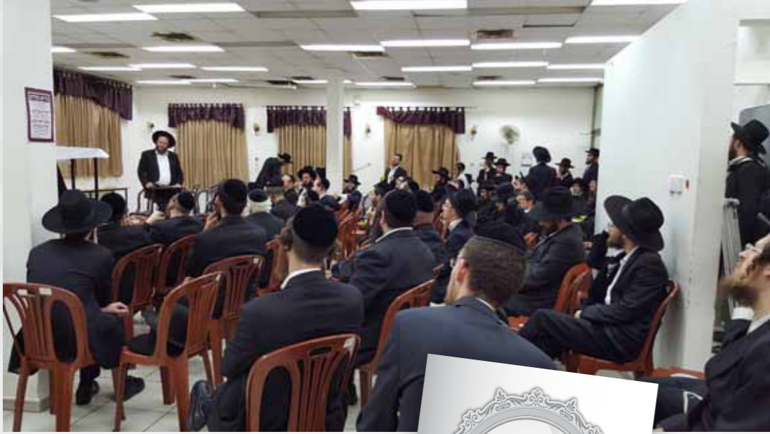
כנס של 'הקבצ' לבחורי ובוגרי הישיבות

"אגב, המהלך הליטאי בעצמו השתנה במשך הזמן. בשלב מסוים החלה 'תנועת המוסר', שגרסה שאין די בלימוד תורה כשלעצמו, אלא חייבים להוסיף לימוד מיוחד בכל יום, שעוסק בדווקא בענייני עבודת ה'. ואמנם היה על זה פולמוס, כשרבים מגדולי ישראל דאז סברו שלימוד תורה כשלעצמו, אפילו בסוגיות הש"ס נתן מענה גם לחלק הזה, אבל בסופו של דבר השיטה התקבלה. "נמצא שבעצם גם לפי השיטה הליטאית, צריכים משהו נוסף מלבד לימוד תורה, שעוסק בעבודת הלב. ומאחר שספרי המוסר כבר לא מדברים לרוב האנשים, מה שאכן גורם שה'סדר מוסר' בישיבות שומם, ובכוללים הוא כבר לא