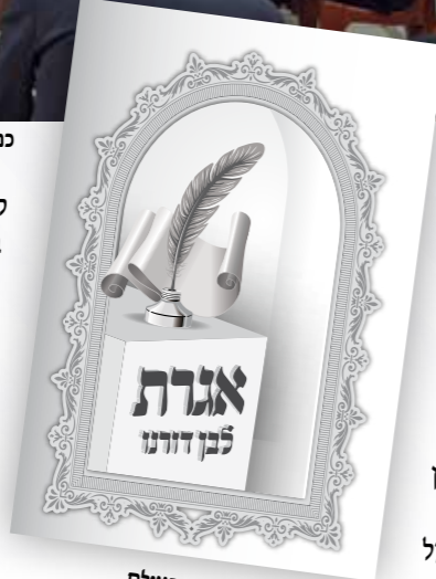
החוברת שחוללה מהפך בעולם הישיבות הליטאית

קיים - צריכים לחפש מענה אחר. ואכן רבים מבעלי המוסר בדור האחרון, החלו לשלב בדבריהם מספרי קבלה חסידות וברסלב, כגון הרב דסלר , שמזכיר אותם בפירוש בספריו 'מכתב מאליהו', הרב וולבה שרומז להם, הרב הוטנר , הרב פינקוס , ר' משה שפירא ועוד - שלא הזכירו תמיד בפירוש אבל גילו לאנשים שהם עושים שימוש בספרים אלו.