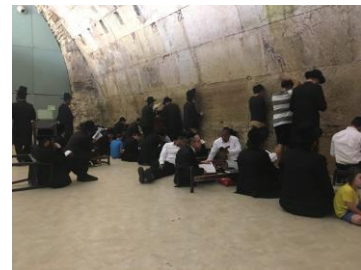
מסר נפלא על תשעה באב

ומתוך הדברים נלמד בעז"ה כיצד דווקא במצבים הללו – טמונים יסודות גדולים וחשובים מאד בעבודת ה', שלא היינו מגיעים אליהם, לולא מצבי ה'ביניים' הללו.