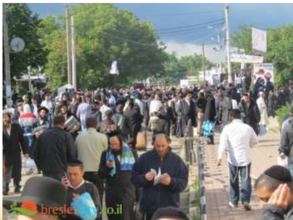
מתחת לצלופן הצבעוני יש משהו הרבה יותר רציני. אומן

אומן מביכה בעליבותה. תושביה אביונים, הדלות שולטת בכל פינה, השוק המקומי לקוח הישר מסיפורי הצדיקים על איכרים שמגיעים ליריד, פורשים את מרכולתם ומייחלים לשוב הביתה עם פרוטה. גם עסקת חליפין של תפוחי אדמה מהגינה תמורת תרנגולת מרוטה, תיחשב עבורם להצלחה. זהו המקום האחרון שהייתם מאחלים לעצמכם לצאת ולבלות בו בחופשה. בתנאים שכאלו, אי אפשר שלא לשוב ולהרהר בשאלה, איך זה שאחרי למעלה ממאתיים שנה מצליח אדמו"ר שלא העמיד ממשיק, להביא לכאן אלפים רבים, שעוזבים בית הם ותפוח בדבש משפחתי, כדי להשתטח על ציון ולומר את התיקון-הכללי?