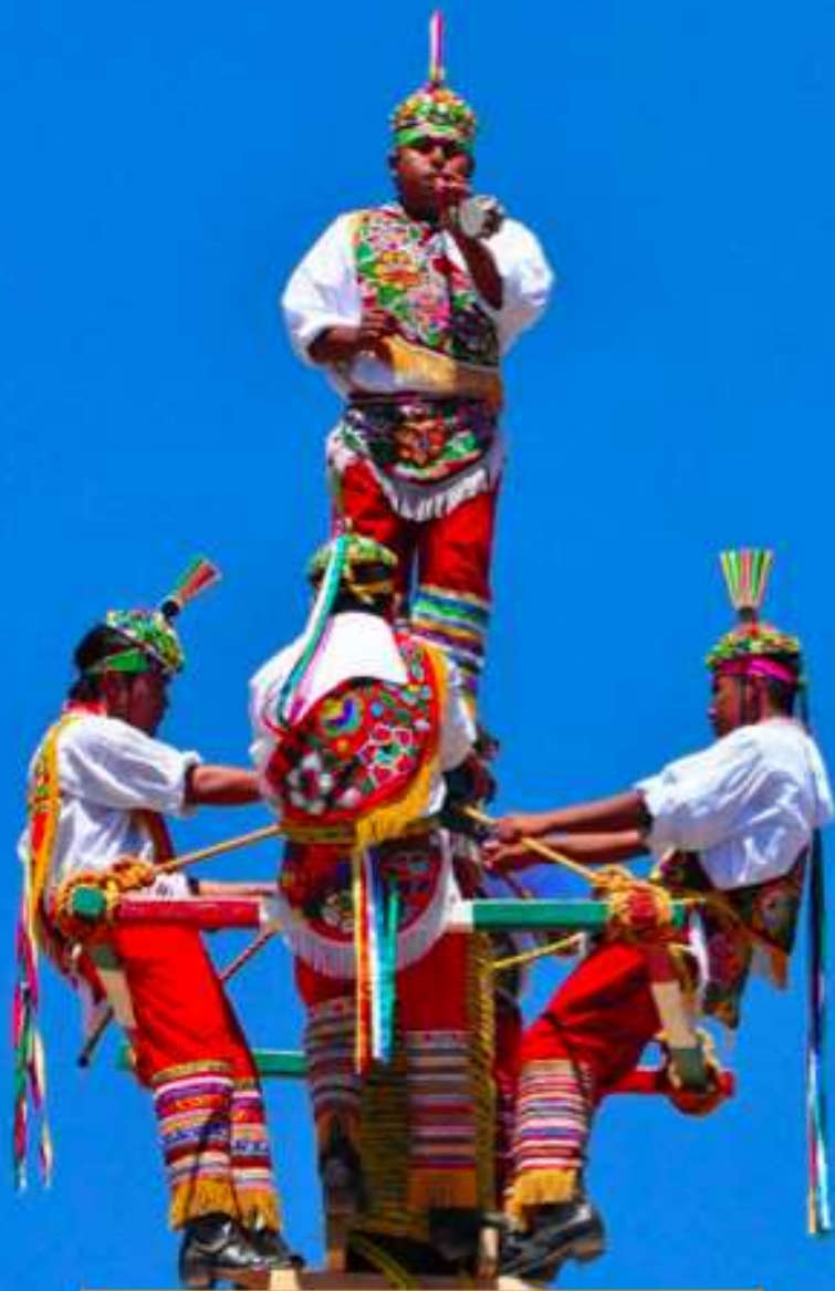
VOLADORES DE PAPANTLA

Otra de las tradiciones y costumbres más famosas del territorio nacional son los llamados “Voladores de Papantla”.