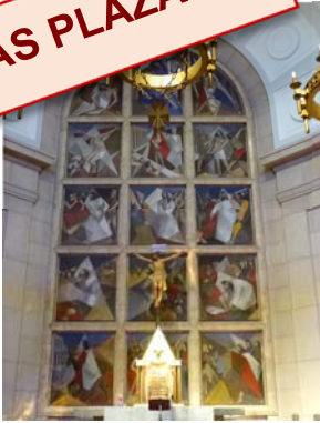
Parroquia Stmo. Cristo de la Victoria