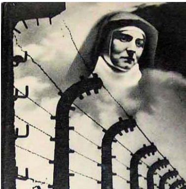
Santa Edith Stein