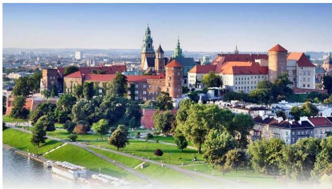
Vista parcial de Cracovia, con el castillo y la catedral de Wawel en primer término

PARROQUIA SANTÍSIMO CRISTO DE LA VICTORIA