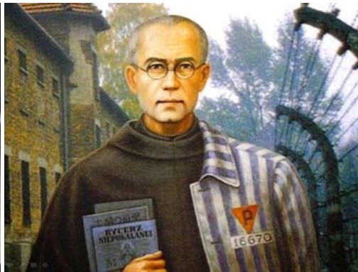
San Maximiliano Kolbe