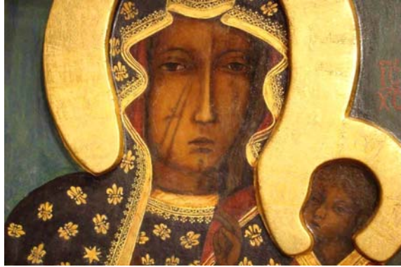
Virgen de Częstochowa