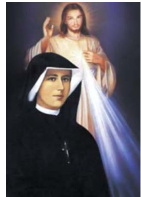
Santa Faustina Kowalska

TRAS LAS HUELLAS DE LOS SANTOS DEL SIGLO XX