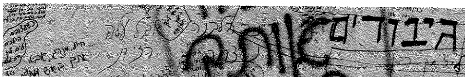
פרויקט תיעוד קירות הגרפיטי אחרי רצח רבין.