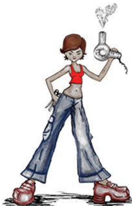
מקור האיור מסי' 17 ברשימת המקורות

עבודה במספרות הנה המקצוע בעל הסיכון הגבוה ביותר לעובדים לפתח מחלות עור במהלך הקריירה שלהם, כאשר הסיכון הינו לפחות פי 10 גדול מהממוצע של כל המקצועות האחרים. כמו כן, בעיות שלד-שריר המדווחות על ידי הספרים/ספריות גבוהות פי 5 מאשר הערך עבור עובדים במקצועות שונים.