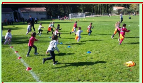
« Chat et souris ! »

Notre rencontre « Jeux traditionnels » sous le soleil, au stade Fontcalde de Céret pour 150 élèves des écoles maternelles d'Argelès, Sorède, Le Boulou et Céret.