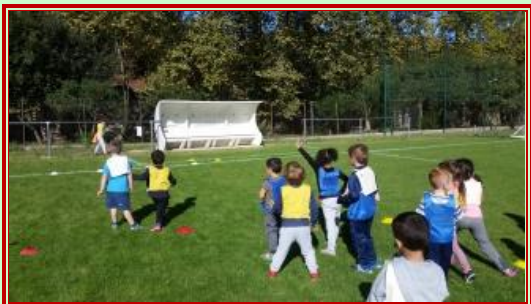
«1,2,3, chat! »

Notre rencontre « Jeux traditionnels » sous le soleil, au stade Fontcalde de Céret pour 150 élèves des écoles maternelles d'Argelès, Sorède, Le Boulou et Céret.