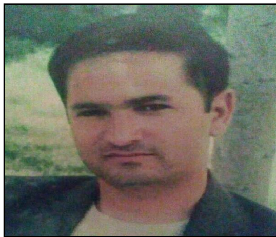
نویسنده: فرهاد بهروز

کرد و این آوردن صلح را مربوط یک شورا و حتی چند ارگان دولتی ندانند تطبیق عدالت و قانون بطور، یکسان در همه ادارات دولتی بخصوص ارگانهای تنفیذ و تحکیم قانون ایجاد شغل و زمینه کار به هر طریقه ممکن به اقشار مختلف مردم، نکاتی‌اند که در تامین امنیت و رسیدن به آرزوی صلح مردم را کمک خواهد نمود. در کاپیسا وقتی خواسته‌های مخالفین چون قبل از این وقتی مخالفین مسلح به حکومت می‌پیوستند فقط هشت هزار افغانی برای شان داده می‌شد و دیگر از آینده خود و فامیل شان دیگر خبری نبود و گاهی اوقات با برگشت به ساحه شان از طرف رفیق‌های قبلی به قتل می‌رسیدند. اگر کمیته ولایتی صلح، امنیت ملی، بخش استخبارات پولیس و متنفذین محل به فکر واحد برسند و زمینه زندگی صلح آمیز را به مخالفین مسلح دولت ایجاد کنند تا باشد هم خود و هم فرزندان شان به درس و تعلیم، صحت و در مجموع حقوق مدنی شان دسترسی داشته ..