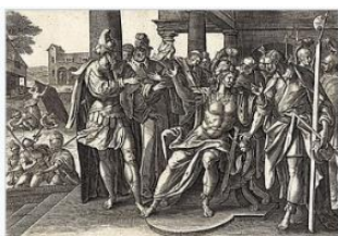
אחיתופל וחושי הארכי מיעצים לאבשלום במרד נגד דוד המלך, תחריט מאת Johannes Wierix (אנ')

כיוני לעצה רעה. הרקע לביטוי הוא העצה שיעץ אחיתופל הגילוני לאבשלום במאבקו נגד דוד אביו. בניגוד למשמעות הביטוי, עצת אחיתופל בסיפור הייתה דווקא עצה טובה. אחיתופל יעץ לאבשלום להתקיף את צבא דוד מתקפת פתע, כי ידע שצבא דוד אינו ערוך לקרב. חושי, שגם הוא היה יועץ לאבשלום, טען שעצת אחיתופל רעה וכדאי לחכות עם המתקפה. חושי היה מרגל מטעם דוד ולכן הטעה את אבשלום במתכוון. אבשלום הקשיב לחושי מכיוון שכך ה' כיוון שיקרה: "וְהָיָה צֶדֶק לְהִפְרֹת עֵצַת אַחִיתֹפֶל הַטּוֹבָה לְכַעֲבוֹר הַבָּיָא ה' אֶל אֲבִשְׁלֹם אֶת הַרְעָה" (שמואל ב' יז, יד). חושי עדכן את צבא דוד איך יפעל אבשלום ובעקבות זאת הביס צבא דוד את צבא אבשלום.