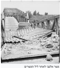
גשר אלבי לאחר ליל הנשרים

מדענית צרפתייה ממוצא פולני, חלוצה בחקר הקרינה הרדיואקטיבית. זכתה פעמיים בפרס נובל: בשנת 1903 זכתה בפרס נובל לפיזיקה בזכות מחקרה על תופעת הקרינה, ובשנת 1911 זכתה בפרס נובל לכימיה על גילוי הרדיום והפולוניום, ועל חקר הרדיום. מארי קירי הייתה הדמות המפורסמת ביותר בזמנה, בתחום המדע, אחרי איינשטיין. היא ובעלה פייר גילו חומרים מיוחדים שפולטים אנרגיה אדירה אלו הם החומרים הרדיואקטיביים. האנרגיה העצומה שפלטו החומרים החדשים הייתה מקור לשמחה ולתקווה אך גם טמנה בחובה סכנה. שני החוקרים לא ידעו את גודל הסכנה של הקרינה מחומרים אלה, והם טיפלו בהם ללא אמצעי הגנה וללא מחסומי קרינה. בריאותם נפגעה קשות. מארי חלתה בסרטן הדם ומתה בשנת 1934. מארי קירי - המדען היחיד שזכה לקבל שני פרסי נובל בנושאים מדעיים! אחד מהם במשותף עם בעלה (פייר), מעניין לציין שגם בתה ובעלה קיבלו שניהם פרס נובל בנושא חומרים רדיואקטיביים. הרחבה למתעניינים