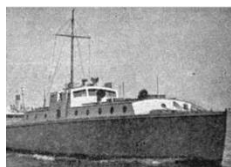
הספינה "איר חים", בה הפליגו הכ"ג

כ"ג יורדי הסירה הוא כינויים של עשרים ושלושה לוחמי "ההגנה", אשר נעלמו, ביחד עם קצין בריטי בשם פאלמר שהתלווה אליהם, בדרכם לביצוע פעולת חבלה בבתי הזיקוק בטרפולי שבלבנון. יש המשתמשים בכינוי "כ"ד יורדי הסירה" כדי לכלול גם את הקצין הבריטי. זכרם הונצח באנדרטה בהר הרצל, בלוח זכרון בטיילת בתל אביב, בית הספר לקציני ים נקרא על שמם, בערים רבות יש רחוב על שמם ואף הייתה ספינת מעפילים שנקראה "כ"ג יורדי הסירה". הרחבה למתעניינים